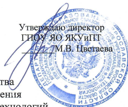
График дежурства колледжа управления и профессиональных технологий на 1 семестр 2022-2023 учебного года (корпус №1)